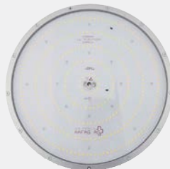
Luminaire de plafond rond 340 / 380 / 440