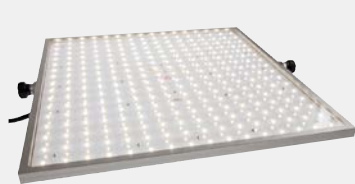
Éclairage pour plafonds Quatt 380

Les lumières LED suivantes sont également disponible chez nous.